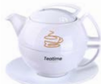
Imperial Set 220 ml