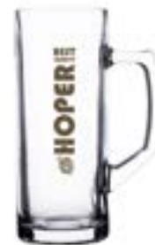
Mainz 500 ml