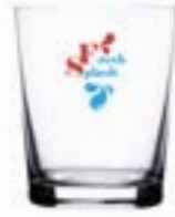
Splash 250 ml