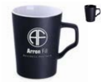
Glen Supreme 380 ml

Heben Sie Ihre Marke hervor. Nutzen Sie hierfür unsere stylischen Neuheiten. Unsere neuen Produkte werden in den ersten beiden Quartalen diesen Jahres auf den Markt kommen.