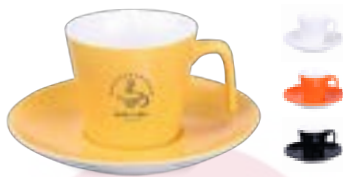
Eve Set 180 ml