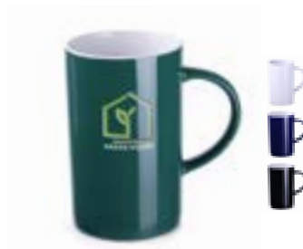
Viva 300 ml