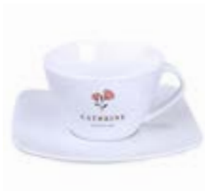
Luna Set 180 ml