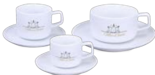
Horizon Set 80 ml / 240 ml / 280 ml