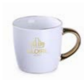
Handy Style 330 ml