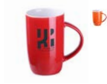
Fox 270 ml