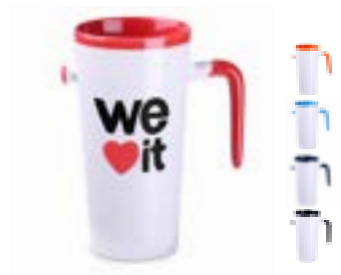
Idea 390 ml