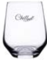
Chill 400 ml