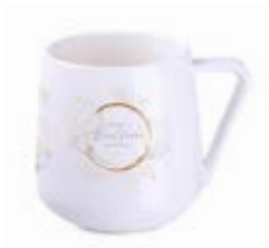
Aster 350 ml

Ihnen stehen ca. 20 interessante Modelle von Tassen und Bechern aus der IVORY-Linie zur Verfügung, die durch ihre Form, Farbkombinationen und zum Teil matten Oberflächen überzeugen.