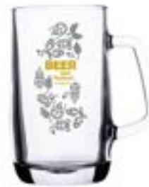
Frankfurt 500 ml