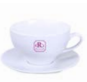
Venezia Set 450 ml