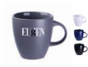
Fiord 300 ml