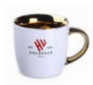
Handy Glam 330 ml