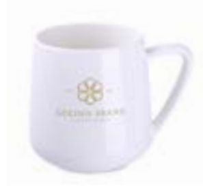
Eris 350 ml