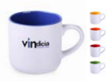
Diego Pure 350 ml