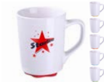
Ivory 300 ml