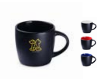
Handy Small Supreme 100 ml