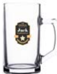
Bonn 500 ml