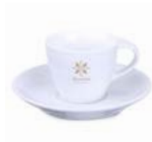
Vision Plus 200 ml