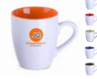
Ilona Duo 300 ml