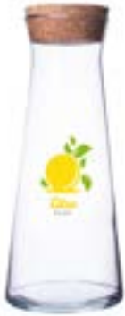
Mia 1000 ml