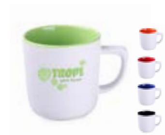
Rico Pure 250 ml