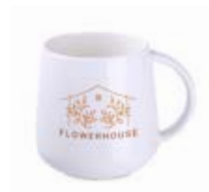
Melody 350 ml