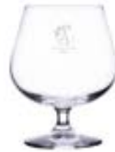
Howard 480 ml