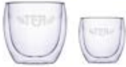
Virgo 80 ml / 220 ml