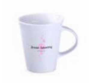
Real 290 ml