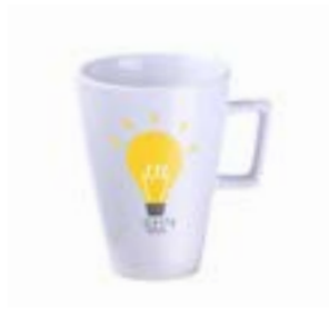
Daily 300 ml