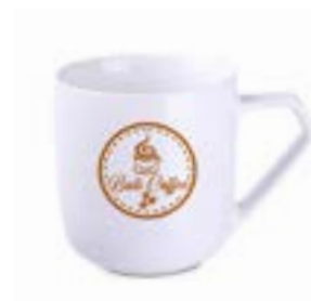
Impress 400 ml