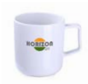
Horizon 350 ml