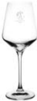
Aria 420 ml