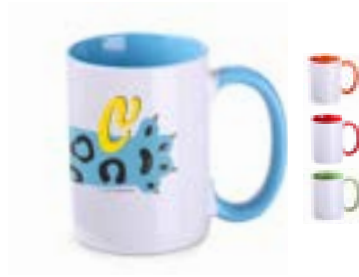
Evergreen 300 ml