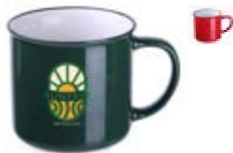
Camp 300 ml