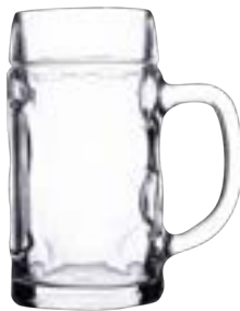
Munich 500 ml