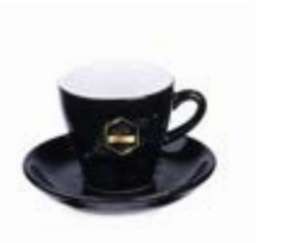
Verona Set 80 ml