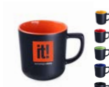
Rico Supreme 250 ml