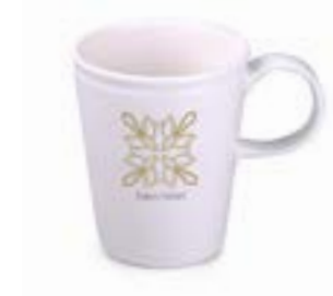
Cotton 310 ml