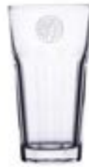
Max Duo 300 ml