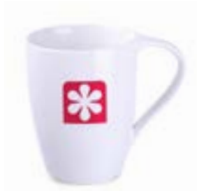
Vision 330 ml